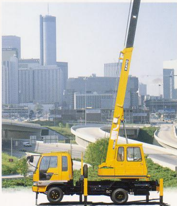
※本カタログに記載されておりませんが性能ならびに仕様は、改良などによりお届けいたします製品と異なる場合がありますので、あらかじめご了承ください。

●クレーンに関しては、労働安全衛生法が適用されます。 ●新車の労働基準監督署に設置報告してからお使いください。 ●道路を通行する場合は、車両検査に合格した状態で通行してください。